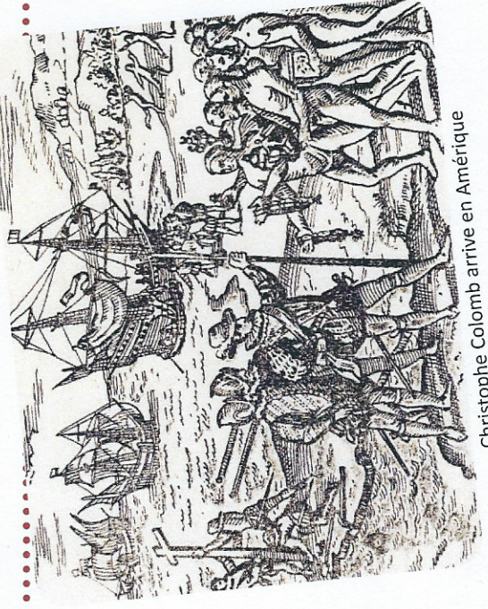
Christophe Colomb arrive en Amérique

Texte 2 Christophe Colomb, la découverte de l'Amérique , 1492.