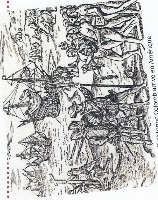
Christophe Colomb arrive en Amérique

Texte 2 Christophe Colomb, la découverte de l'Amérique , 1492.