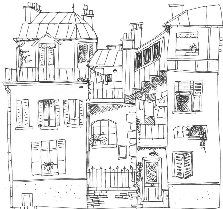
→ la maison de "Mon Oncle" - Jacques Tati.